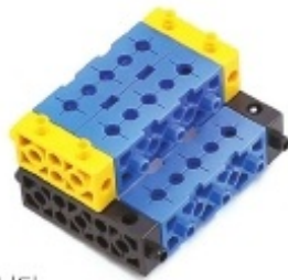
그림 4번과 5번에서 만든 모형을 조립합니다.