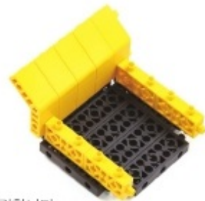
그림 8번과 10번에서 만든 모형을 조립합니다.