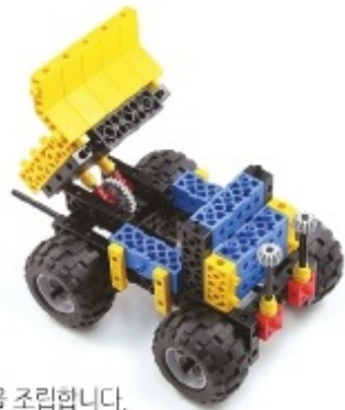
그림 12번과 21번에서 만든 모형을 조립합니다.