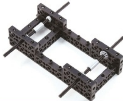
그림 2번에서 만든 모형에 축, 기어, 연결객을 조립합니다.