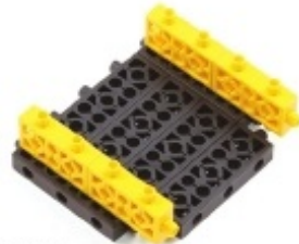
그림 9번에서 만든 모형에 2단셀을 조립합니다.