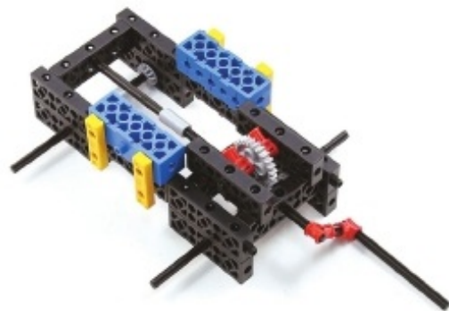
그림 7번과 17번에서 만든 모형을 조립합니다.