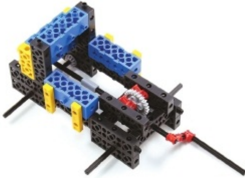
그림 6번과 18번에서 만든 모형을 조립합니다.