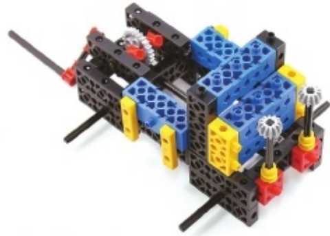
그림 13번과 19번에서 만든 모형을 조립합니다.