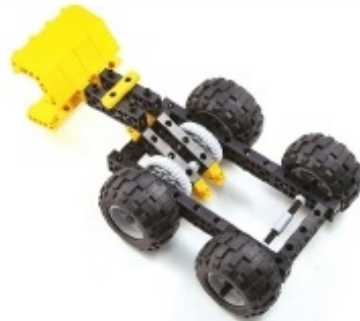
그림 7번과 10번에서 만든 모형을 조립합니다.