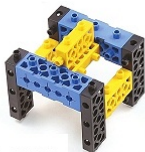
그림 12번과 13번에서 만든 모형을 조립합니다.