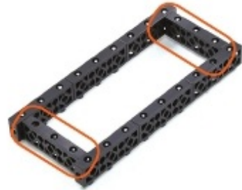
그림 1번에서 만든 모형에 2번 돌기셀을 조립합니다.