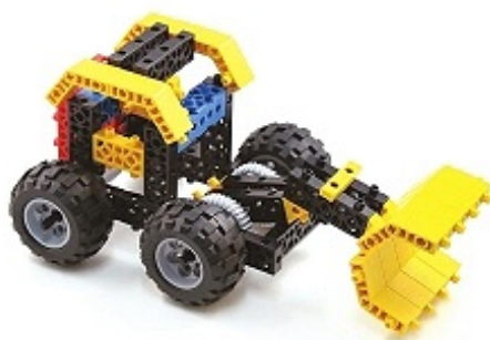
그림 11번과 17번에서 만든 모형을 조립합니다.