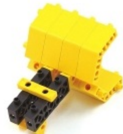
그림 8번과 9번에서 만든 모형을 조립합니다.