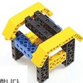
그림 14번과 15번에서 만든 모형을 조립합니다.