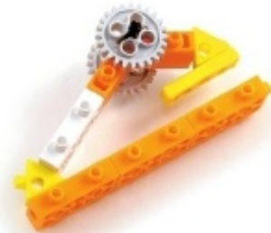
그림 3번과 4번에서 만든 모형을 조립합니다.