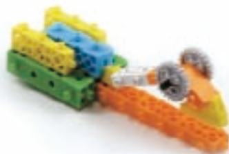
그림 2번과 5번에서 만든 모형을 조립합니다.