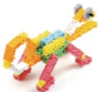
그림 8번, 9번, 10번에서 만든 모형을 조립합니다.