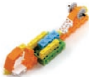
그림 6번과 7번에서 만든 모형을 조립합니다.