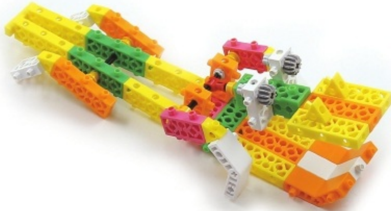
그림 13번과 14번에서 만든 모형을 조립합니다.