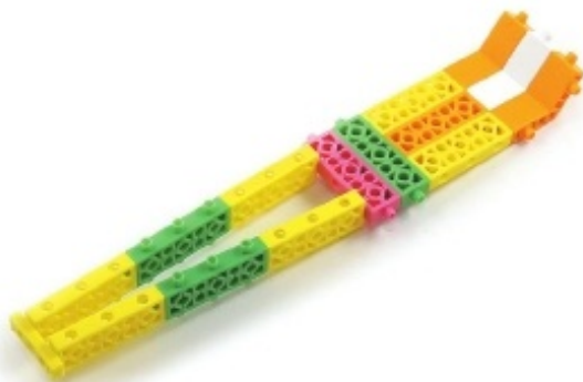
그림 3번과 4번에서 만든 모형을 조립합니다.