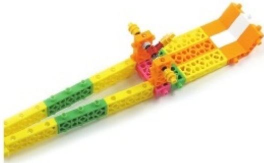
그림 5번과 6번에서 만든 모형을 조립합니다.