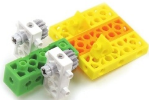
그림 8번과 9번에서 만든 모형을 조립합니다.