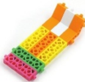
그림 1번과 2번에서 만든 모형을 조립합니다.