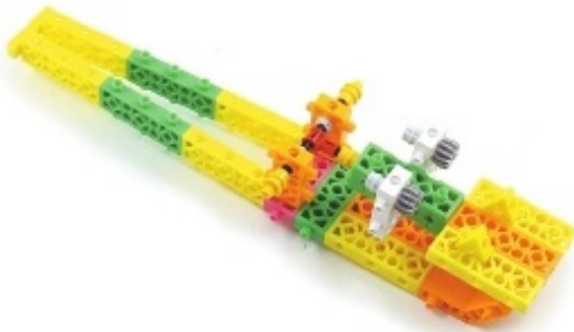
그림 7번과 10번에서 만든 모형을 조립합니다.