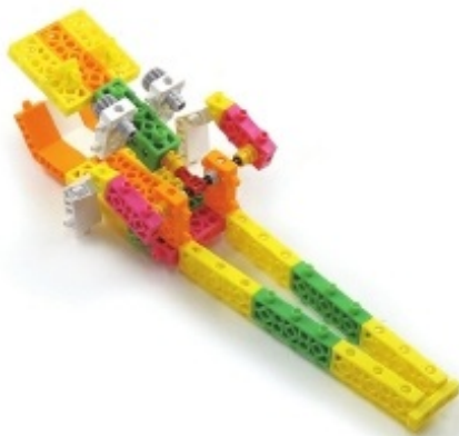
그림 11번과 12번에서 만든 모형을 조립합니다.