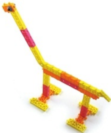
그림 5번, 6번, 7번에서 만든 모형을 조립합니다.