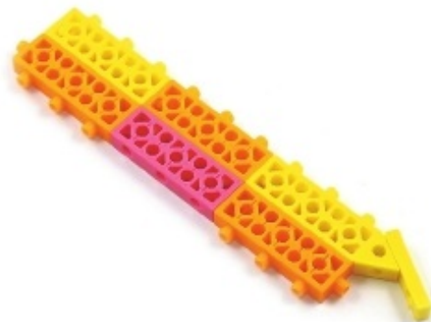
그림 2번과 3번에서 만든 모형을 조립합니다.