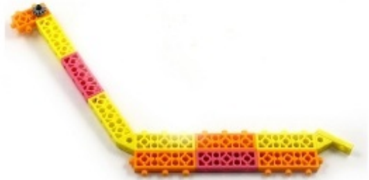
그림 1번과 4번에서 만든 모형을 조립합니다.