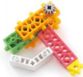
그림 1번과 2번에서 만든 모형을 조립합니다.